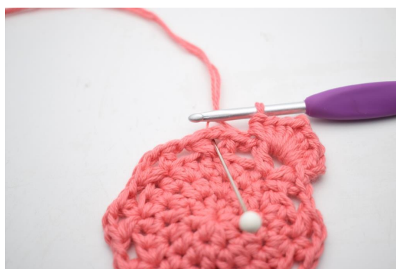
19. "Faire 4 demi-br, 1 ml et 4 demi-br dans l'espace de ml".