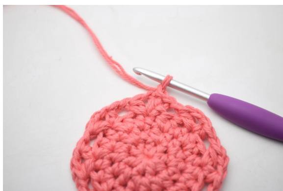
16. Faire 1 ml.