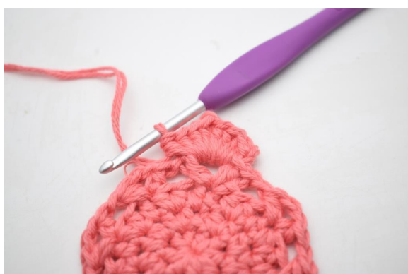
18. Comme ceci.