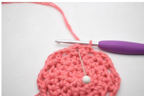
14. Faire des mc jusqu'à atteindre le premier espace de ml.