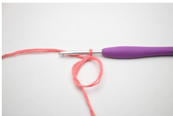
1. Faire un Cm et 1 ml.