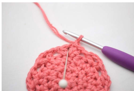
17. "Faire 4 demi-br, 1 ml and 4 demi-br dans l'espace de ml".