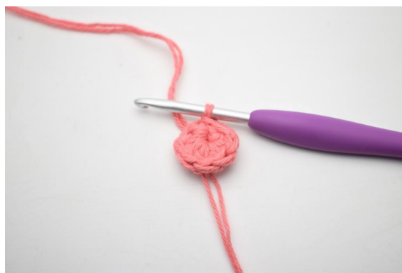
2. Faire 8 demi-br dans le cercle. Finir avec 1 mc. (8)