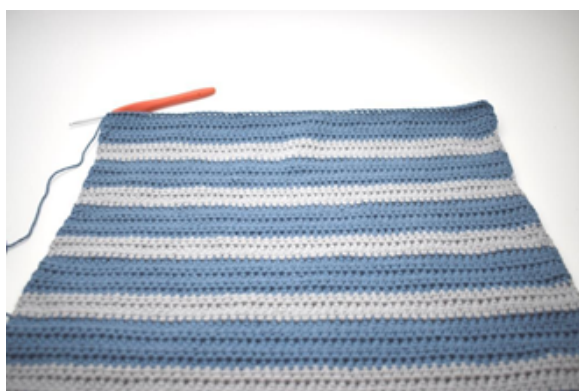
Tourner et faire 1 ml.