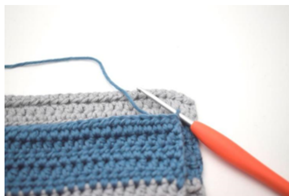
Assembler les 2 côtés les plus courts en utilisant les mc.