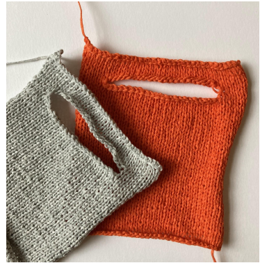
Photos : Rabattre, Montage à boucles et Les pièces terminées