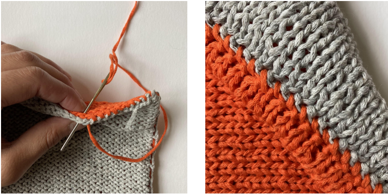
Photos : Couture du fond, Couture terminée vu depuis l'endroit de l'ouvrage