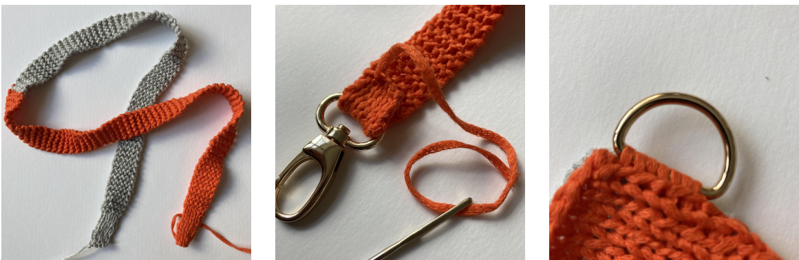
Photos : Anse, Montage du mousqueton, Montage de l'attache en demi-cercle

Coudre les mousquetons au bout de chaque anse en pliant la partie tricotée au point jersey de l'anse autour du mousqueton et coudre avec le bout de fil.