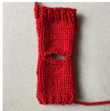
Devant et dos terminés