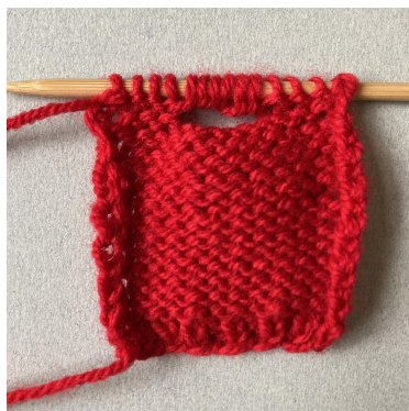
Fermeture du col dans le dos