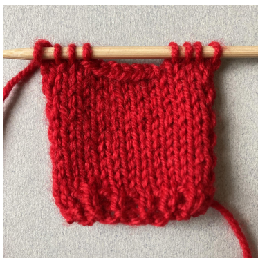
Ouverture du col devant

Ouverture pour le col : Tricoter 4 m, rabattre 6 m, tricoter 4 m