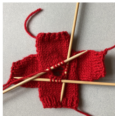
Mailles relevées pour le col