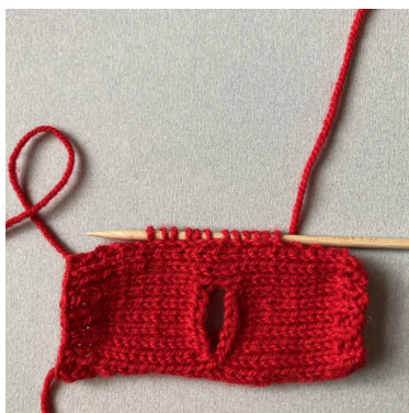
Mailles relevées pour la manche

Tricoter la seconde manche de la même façon.