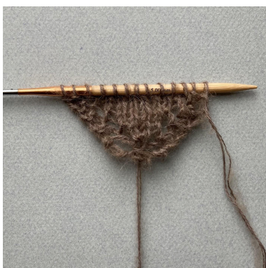
Début du bandana

Répéter *-* 3 fois de plus = 13 m sur l'aiguille