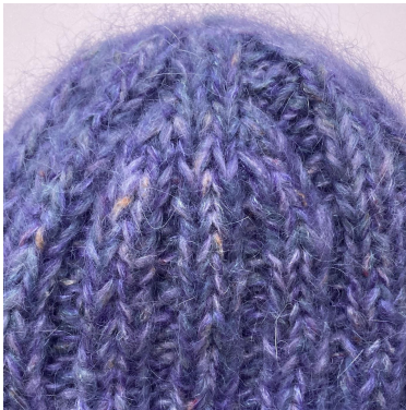
Détail : Diminutions

Plier le rebord du bonnet (environ 7 cm).