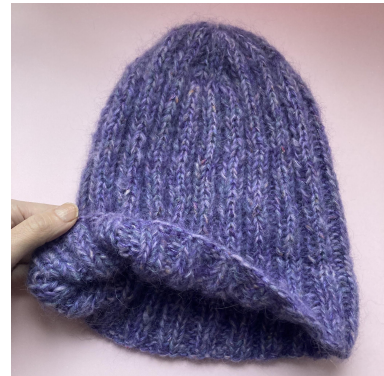
Détail : Rebord