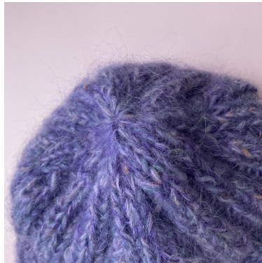
Détail : dessus