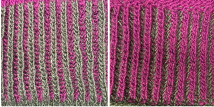
Endroit du travail