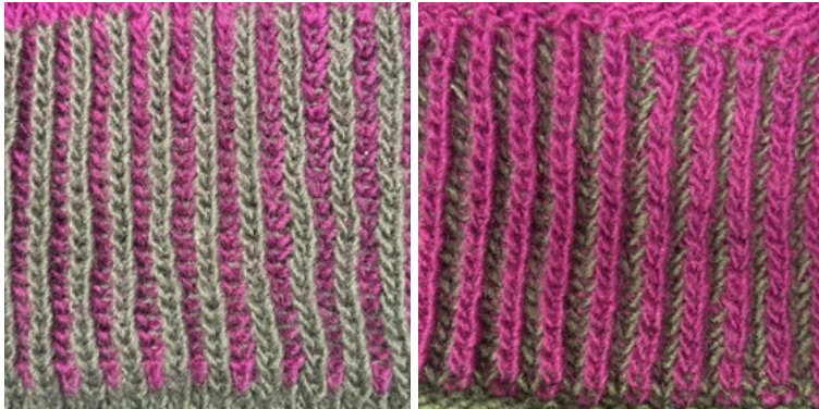
Endroit du travail