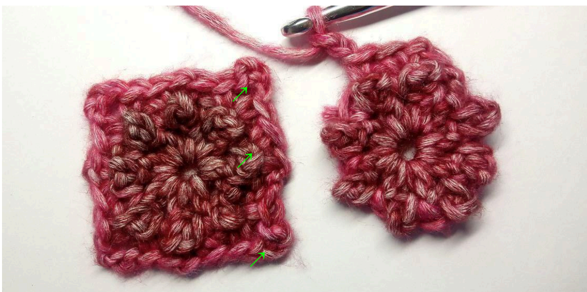
Carré A (à gauche) Carré B (à droite)

Joindre ensuite les 2 (3) prochains carrés en ligne. Pour cela, répéter les trs 1-2 pour chaque carré et continuer avec le tr 3 de la manière suivante : 1 ml (ne compte pas comme une m), (ms, 1 ml, ms) dans le prochain esp 1 ml, (ms, 2 ml) dans le prochain esp 1 ml, ms dans l'esp 3 ml du coin du carré A (garder les carrés ENV contre ENV, insérer le crochet depuis l'arrière et vers le devant lorsque vous travaillez le carré A), revenir au carré B et réaliser une ms dans le même esp que la ms précédente, ms dans le prochain esp 1 ml, ms dans l'esp 1 ml opposé au carré A, revenir au carré B et réaliser une ms dans le même esp 1 ml que la ms précédente, ms dans le prochain esp 1 ml, ms dans l'esp 3 ml du coin opposé au carré A, 2 ml, revenir au carré B et faire une ms dans le même esp 1 ml que la ms précédente, *(ms, 1 ml, ms) dans le prochain esp 1 ml, (ms, 3 ml, ms) dans le prochain esp 1 ml* 2 fois, joindre avec 1 mc dans la 1ère ms. Couper le fil, le sécuriser et le cacher