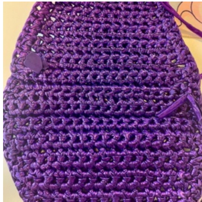
Envers du projet

Rang 1: Maille serrée dans toutes les mailles. 1 maille en l'air, tourner.