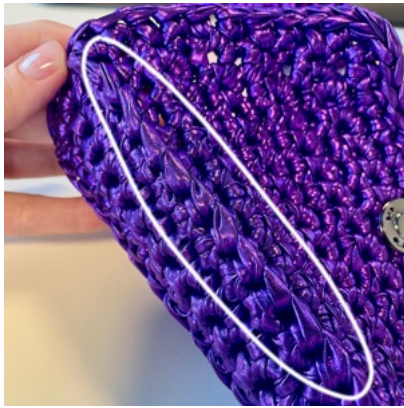
Endroit du projet.